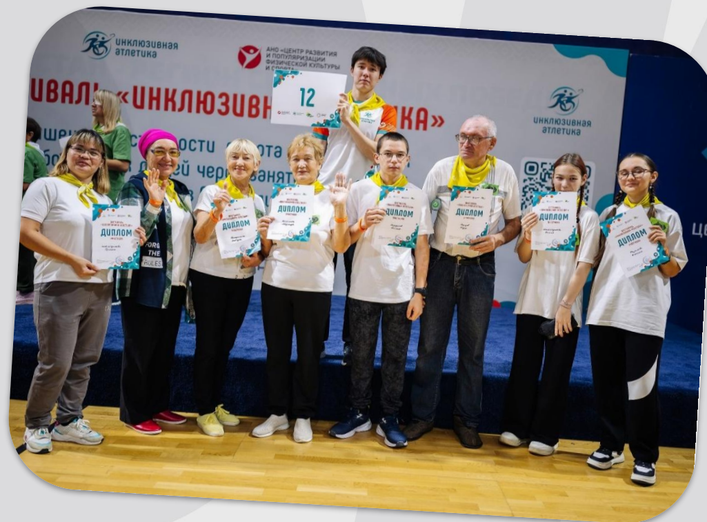
Республиканский фестиваль «Инклюзивная атлетика» 27 сентября 2025 года